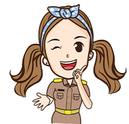
เลขานุการ

หัวหน้าส่วนราชการ หรือ ผู้บริหารสถานศึกษา ไม่น้อยกว่า 2 คน