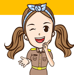
ประธานกรรมการ

รองนายก อบต. หรือ หัวหน้าส่วนราชการที่ได้รับมอบหมาย